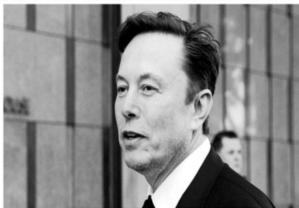
El multimillonario Elon Musk, el 24 de enero de 2023.

«El comercio bilateral con India en taka y rupias reducirá la presión del dólar estadounidense. Ambos países se beneficiarán de esto», dijo Afzal Karim, director ejecutivo y general de Sonali Bank Limited, el principal banco comercial de propiedad estatal de Bangladés.