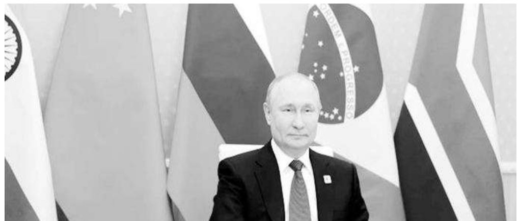
Vladimir Putin, el presidente ruso, participa en la XIV Cúpula de los BRICS 2022

«Y esta contradicción entre los intereses políticos y económicos de quienes imponen sanciones antirrusas persiste», señaló Vinográdov.