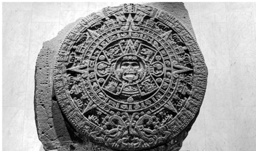
Piedra del Sol mexicana.

Unos investigadores lograron explicar la forma en la que el almanaque se relaciona con el movimiento de los planetas.