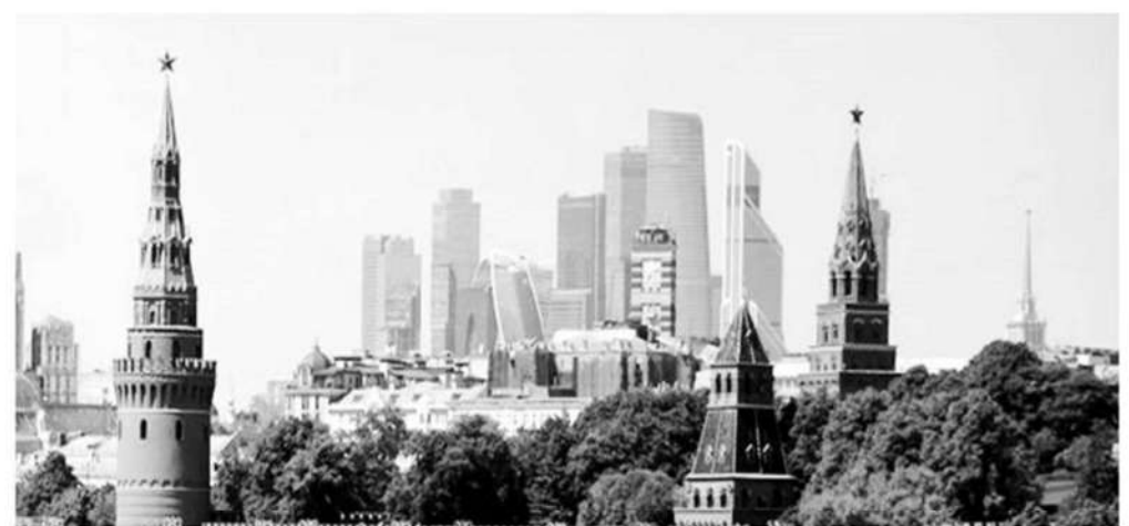
El Kremlin y el Centro Internacional de Negocios de Moscú

Explicó que la causa del resultado actual de las restricciones proviene de la naturaleza bidireccional de las sanciones. Los últimos cambian la cobertura del mercado por empresas, por eso en cuanto un actor abandona el mercado, otros ocupan su lugar. En este sentido, destacó que, si las empresas realizaban negocios durante algún tiempo en Rusia, la salida del país ahora constituye una pérdida tangible para ellas y los países de los que provienen.