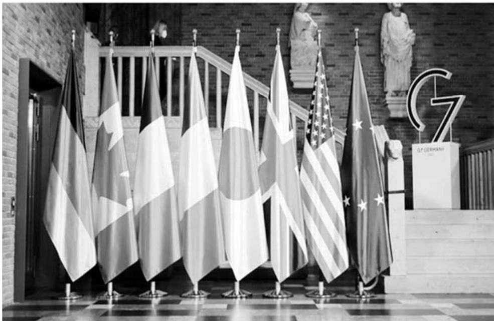
Banderas de G7

Los países del G7 examinan la posibilidad de imponer una prohibición a la exportación de casi todos los productos a Rusia, pero ¿será esto realmente posible? Sputnik conversó con varios expertos para averiguarlo.