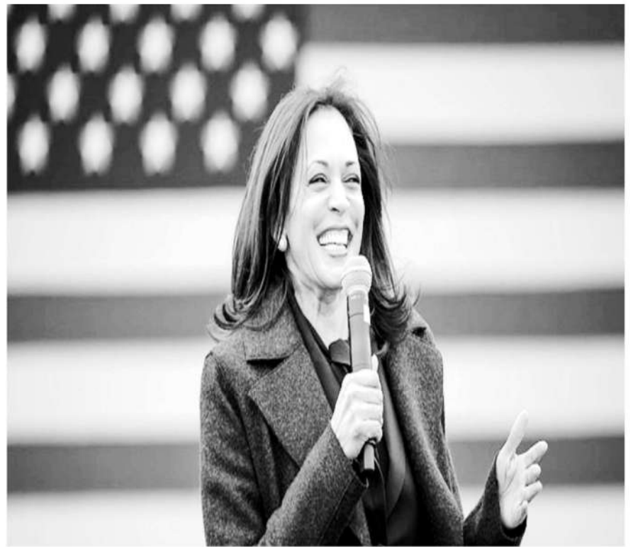
La vicepresidenta de EE. UU., Kamala Harris

La Casa Blanca indicó que la vicepresidenta estadounidense se equivocó al decir «población» cuando en realidad se refería a la «polución».