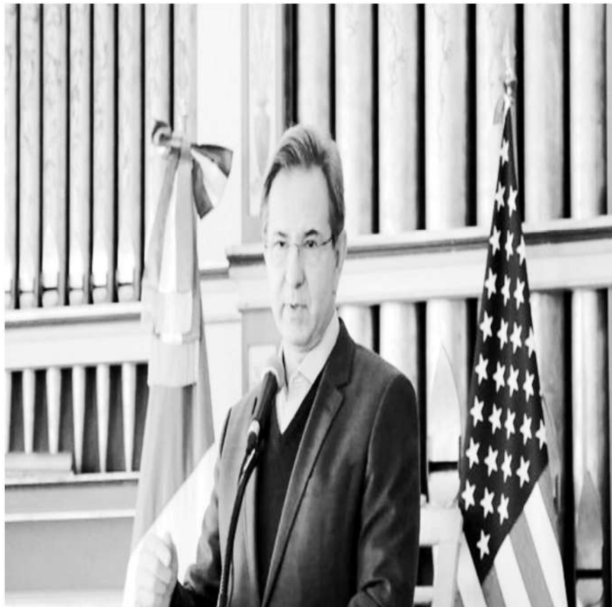
Esteban Moctezuma, embajador de México en Estados Unidos

Sputnik 15 de julio del 2023.-El embajador de México en Estados Unidos, Esteban Moctezuma, señaló que los ciudadanos estadounidenses son los que más trafican fentanilo en su propio país, a pesar de la insistencia de Washington de culpar a terceros por su crisis de opiáceos que se cobra la vida de decenas de miles de personas cada año.