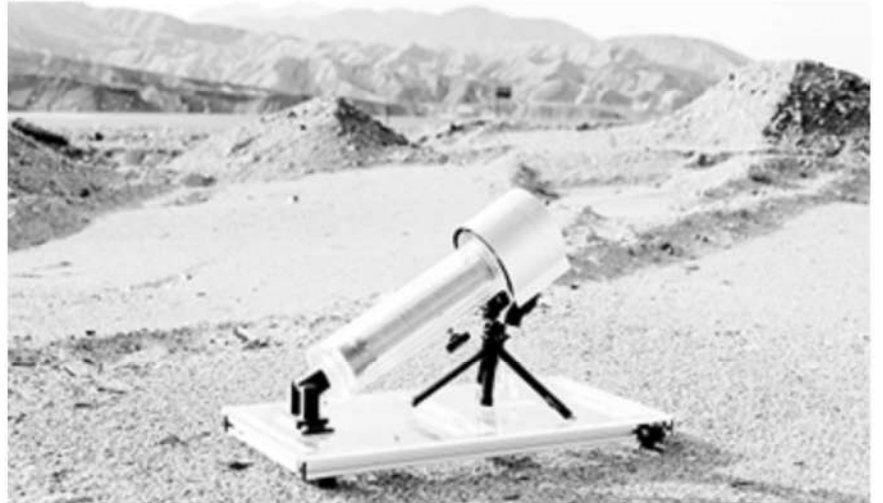
El dispositivo para recolectar agua desarrollado por investigadores de la Universidad de California, en Berkeley. UC Berkeley

En la prueba, el aparato pudo recolectar hasta 285 gramos o un vaso de agua por día, en condiciones de muy baja humedad.