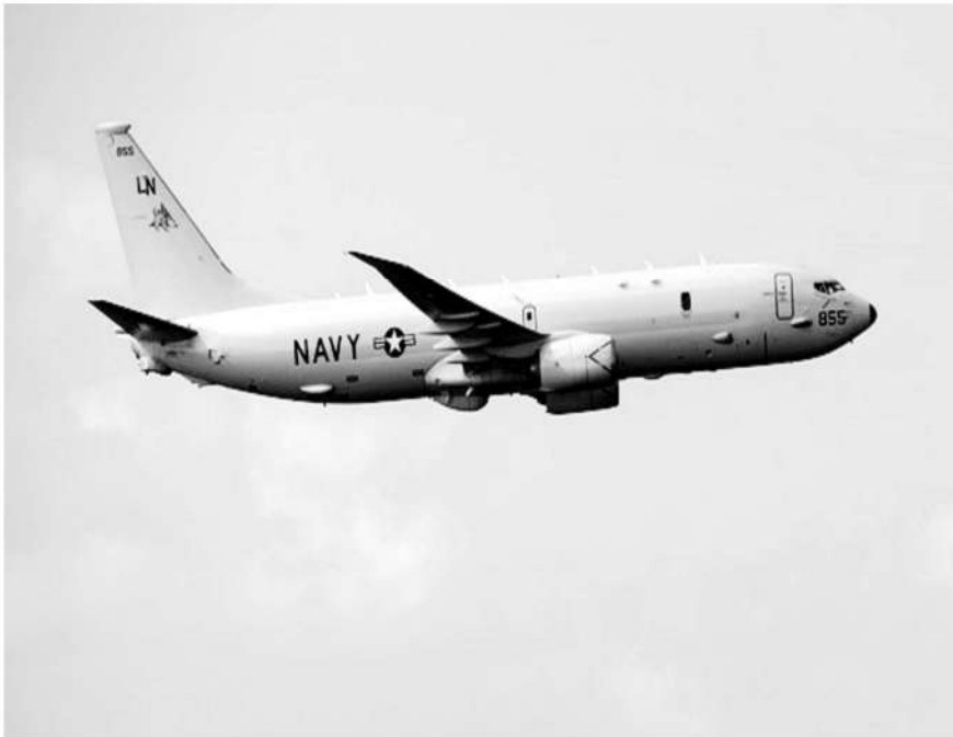
El avión de reconocimiento P-8 a Poseidón de la Marina de EE. UU.

Los aviones de combate chinos rastrearon y monitorearon el avión de reconocimiento P-8 a Poseidón de la Marina de EE. UU. Que sobrevoló esa sensible zona en la mañana de este jueves.