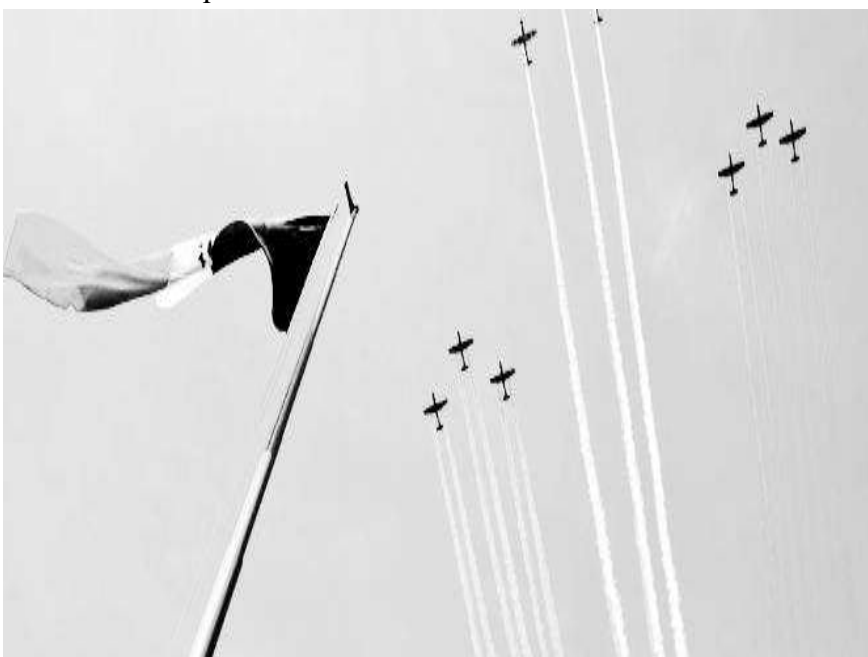
Aviones de las fuerzas armadas sobrevuelan el Zócalo de la Ciudad de México