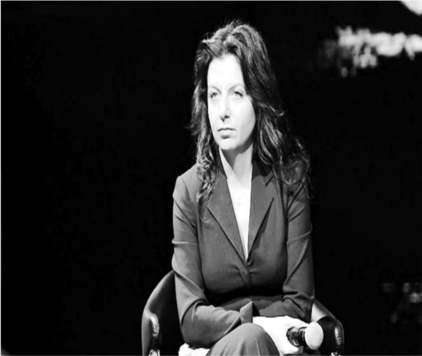
La directora del grupo RT, Margarita Simonián

Además, los servicios especiales de Ucrania planeaban un atentado contra la periodista rusa Ksenia Sobchak.