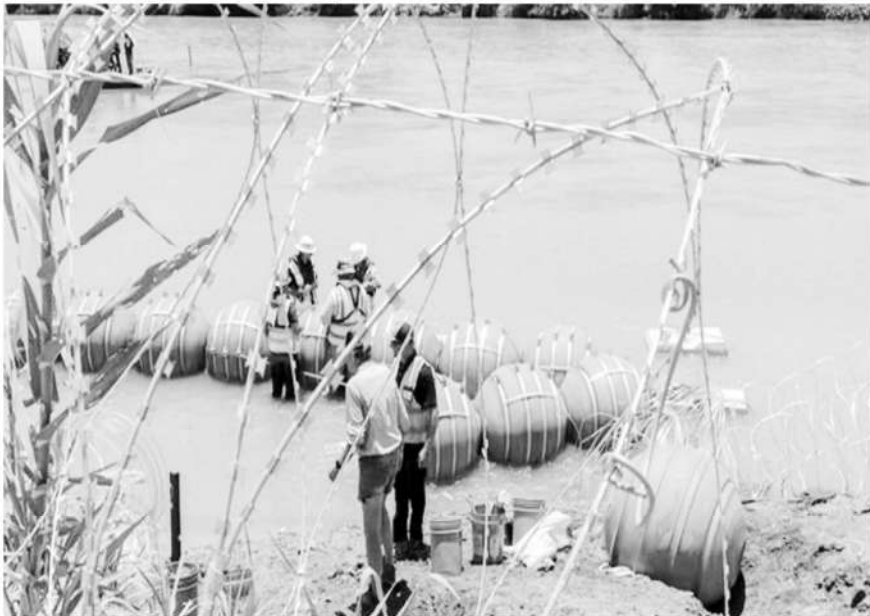
Boyas colocadas en la frontera México-EE. UU.

Sputnik 15.07.2023.-México envió una nota diplomática al Gobierno de Texas por la colocación de un 'muro flotante' compuesto de boyas que fueron colocadas en el río Bravo, justo en el tramo que divide la ciudad de Eagle Pass, Texas, con Piedras Negras, Coahuila.