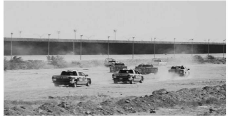
Agentes del Inami realizan un operativo para detener migrantes en la ribera del río Bravo, en Ciudad Juárez, el 24 de septiembre.

diarios del norte del país, las maquiladoras ya están preparando rutas alternas para transportar sus mercancías. Entre las fábricas afectadas por la parálisis logística en seco se encuentran aquellas que ensamblan aparatos electrodomésticos, motocicletas y autoparteras.