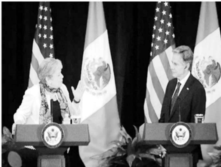
Alicia Bárcena, titular de la SRE y Antony Blinken, secretario de Estado de EU en Washington.

La Jornada, Ciudad de México, 30 de septiembre de 2023.- México y Estados Unidos afirmaron este sábado que a través del Diálogo Económico de Alto Nivel (DEAN) «coordinan estrechamente la asistencia para el desarrollo económico para abordar las causas fundamentales de la migración irregular en el norte de Centroamérica».