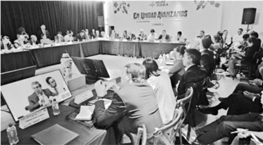
Participantes en el Grupo Puebla en imagen tomada del perfil de X de Evo Morales

La Jornada, Puebla, Pue, 30 de septiembre de 2023.- Durante la inauguración del IX Encuentro del Grupo Puebla, que congrega 200 líderes, luchadores sociales, ex mandatarios y presidentes de 21 naciones, como Argentina, España, Colombia, Cuba, Ecuador, República Dominicana, Venezuela, Chile, Guatemala y México emitieron un llamado urgente de unificación de los países de Latinoamérica, para que «nuestras sociedades aprenden a juntarse y defenderse en una voz común», convocó José Mujica.