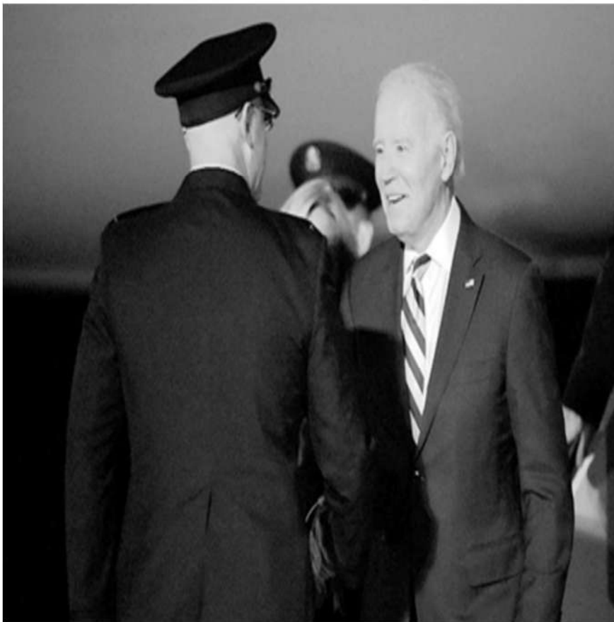
El presidente estadounidense expone que el dinero para otras guerras se gasta en la industria armamentista de su país. La imagen, en Dover, Delaware.

La Jornada, 21 de octubre de 2023.- Washington y Nueva York. Enterrado en los detalles de la solicitud del presidente Joe Biden al Congreso por decenas de miles de millones de dólares en asistencia militar está también el requerimiento de 13.6 mil millones para financiar más agentes de la Patrulla Fronteriza, jueces y funcionarios de migración y asilo y otras medidas de control fronterizo, fondos que seguramente serán necesarios para obtener el apoyo político bipartidista para aprobar el paquete total de 105 mil millones en el Congreso.