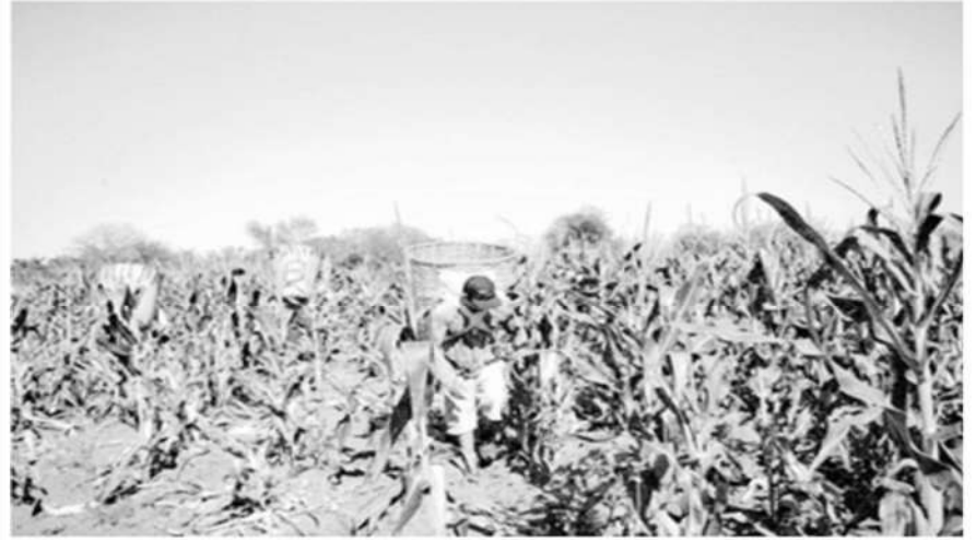
Trabajadores cosechan maíz en una granja de San Luis Potosí (México), en 2021.