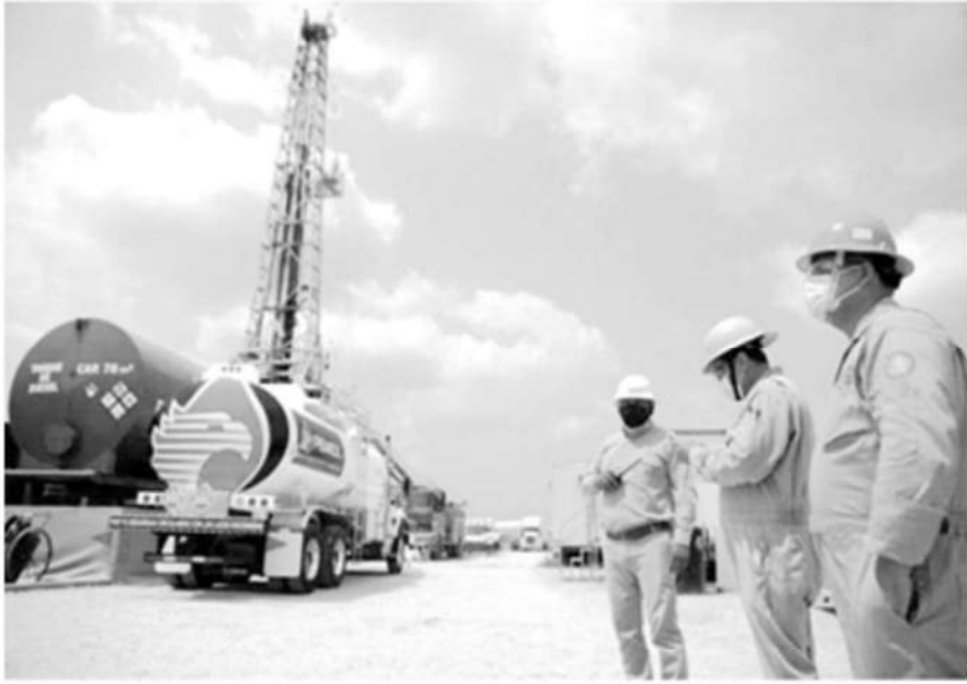
Trabajadores de Pemex en el pozo Dzimpona, en Villahermosa (Tabasco), en marzo de 2021.

Los legisladores avalaron en la madrugada de este viernes la iniciativa que prevé recursos por más de nueve billones de pesos en 2024. El dictamen pasará al Senado para su discusión