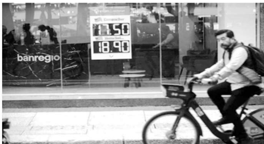
Cotización del dólar en una sucursal bancaria de la Ciudad de México, el 23 de octubre de 2023.

La Jornada, 23 de septiembre de 2023.- Con las tasas de los bonos del Tesoro de Estados Unidos en máximos en el arranque de la sesión, el mercado cambiario en México arrancó la semana con elevada volatilidad, por momentos por arriba de las 18.20 unidades y cerró en 18.1652 unidades por dólar spot. De acuerdo con datos del Banco de México, la moneda nacional se apreció 6.98 centavos frente a la divisa estadounidense, hilando dos avances, debido al debilitamiento del dólar estadounidense de 0.39 por ciento de acuerdo con el índice DXY, que mide el comportamiento de la moneda estadounidense frente a una canasta de seis monedas internacionales.