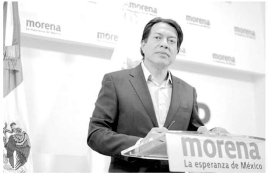
El dirigente nacional de Morena, Mario Delgado, en una imagen de archivo.

López Obrador, en un anuncio de último momento que llega tres días antes del cierre del proceso interno y en medio de una tensa negociación por el reparto de candidaturas por los criterios de paridad aprobados