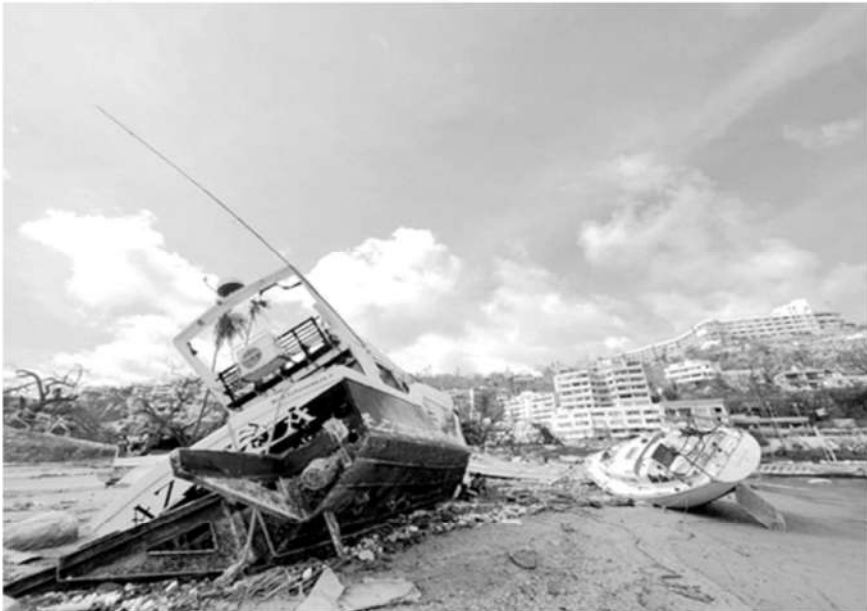
Zona afectada por el huracán 'Otis', en Acapulco, Guerrero, el 27 de octubre de 2023.

La Jornada, 28 de octubre de 2023.- Las secretarías de Salud (Ssa), Marina (Semar) y los institutos Mexicano del Seguro Social (IMSS) y de Seguridad y Servicios Sociales para los Trabajadores (Issste) reportaron el envío de personal médico, enfermería y técnico para apoyar a la población afectada por el huracán Otis, así como el traslado de 12 pacientes pediátricos a hospitales e institutos de alta especialidad en la capital del país, de acuerdo con informes emitidos por las distintas dependencias.