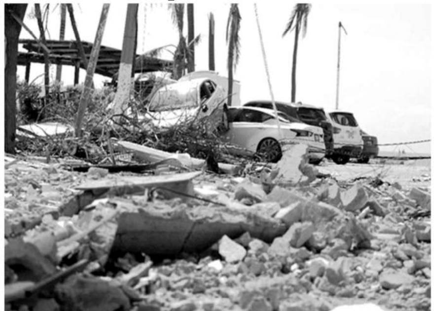
La Comisión Nacional de Búsqueda puso a disposición de las personas una línea telefónica de apoyo para quienes tienen un familiar o conocido que no han podido localizar tras el paso del huracán 'Otis' en Guerrero.

La Jornada, Ciudad de México, 28 de octubre de 2023.- La Comisión Nacional de Búsqueda (CNB) puso a disposición de las personas una línea telefónica de apoyo para quienes tienen un familiar o conocido que no han podido localizar tras el paso del huracán Otis en Guerrero.