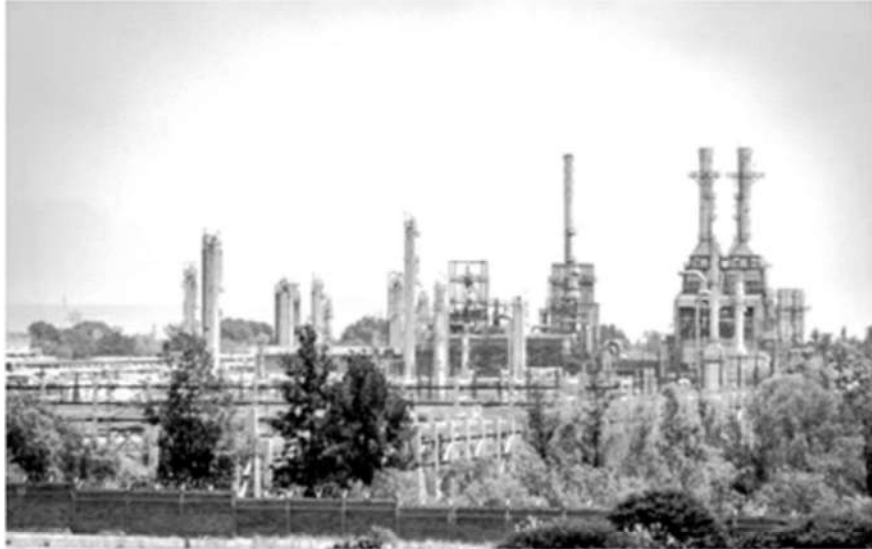
La refinería de Pemex en Tula (Estado de Hidalgo), en 2022. NAYELICRUZ

El informe desvela pagos en exceso e improcedentes, así como la falta de aplicación de penas por retrasos de obras de mantenimiento en 2022