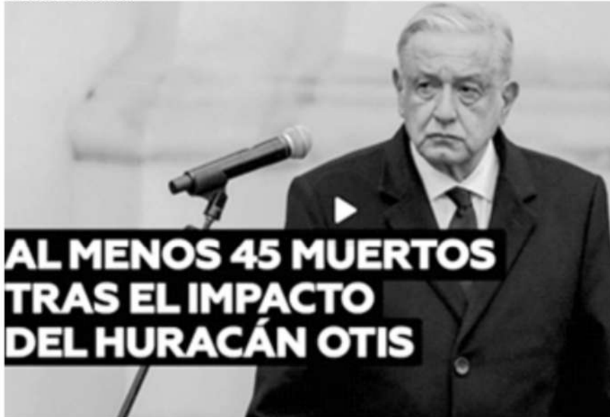
Andrés Manuel López Obrador, presidente de México.

El Gobierno informó que hay otras 47 personas no localizadas.