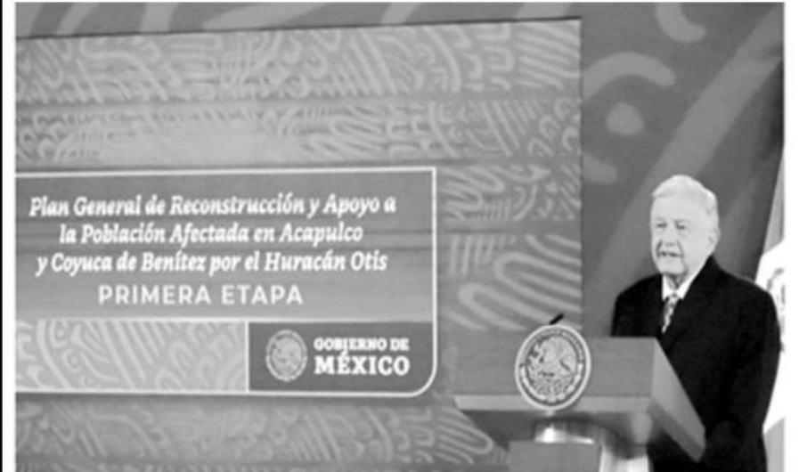
El presidente mexicano, Andrés Manuel López Obrador, en conferencia de prensa.

El huracán Otis destruyó la ciudad costera y dejó un saldo de 46 muertos y 56 desaparecidos.