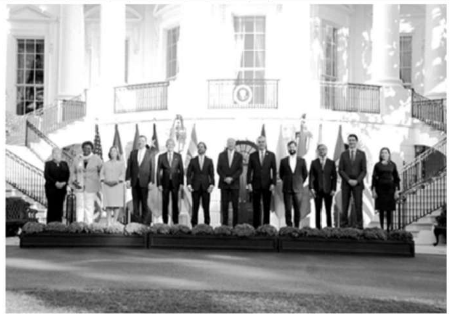
Presidentes y representantes de países que integran la Alianza para la Prosperidad Económica en AL, se reunieron hoy en Washington.

la Prosperidad Económica en las Américas, que fue encabezada por el presidente estadounidense, Joe Biden, y en la que la canciller Alicia Bárcena participó en representación del presidente Andrés Manuel López Obrador, los países integrantes del grupo emitieron una declaración con cinco prioridades de colaboración: fortalecer la competitividad y la integración regional, potenciar la prosperidad compartida y la buena gobernanza; construir una infraestructura sostenible; proteger el clima y el medio