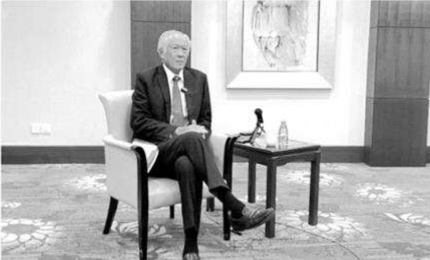
Ministro de Defensa de Singapur, Ng Eng Hen

Global Times. - El compromiso militar es vital: si sois amigos, genera confianza; si sois adversarios potenciales, reduce el riesgo de errores de cálculo, dijo el ministro de Defensa de Singapur, Ng Eng Hen, al Global Times el miércoles durante una entrevista a domicilio, mientras concluía una Visita de cuatro días a Beijing.