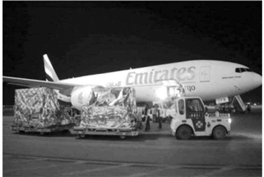
La Secretaría de Salud informó que arribaron al país 648 mil dosis de la vacuna rusa Sputnik V, contra el virus SARS-CoV-2, causante de covid-19, el domingo 19 de noviembre de 2023.

La Jornada, Ciudad de México, 19 de noviembre de 2023.- La Secretaría de Salud informó que esta madrugada arribaron al país 648 mil dosis de la vacuna rusa Sputnik V, contra el virus SARS-CoV-2, causante de covid-19.