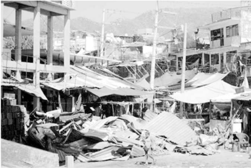
Mercado central de Acapulco, el 13 de noviembre de 2023.

La Jornada, Ciudad de México, 18 de noviembre de 2023.- El secretario de Salud, Jorge Alcocer Varela, señaló que ante la emergencia por el huracán Otis se pusieron en marcha la campaña para manejo y recolección de desechos en las zonas afectadas, con el objetivo de eliminar focos de infección y fauna nociva. Durante la reunión del Centro de Mando para la Atención de Efectos del Huracán Otis, en Acapulco, Guerrero, subrayó que la intensificación de acciones para el manejo y la recolección de residuos en este municipio, así como en Coyuca de Benítez, permitirá no sólo la adecuada disposición final de los desechos que generó el impacto del huracán, sino resolver el rezago histórico que enfrentaba el puerto por las toneladas de basura que se producían.