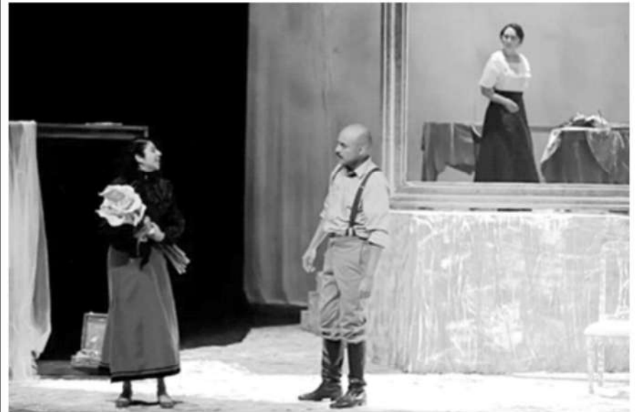
Presentación de la obra de teatro 'Más allá de los hombres'.

La Jornada, Ciudad de México, 18 de noviembre de 2023.- El sector de la cultura aportó 2.9 por ciento de la economía mexicana en 2022, pues el producto interno bruto (PIB) generado por los bienes y servicios sumó 815 mil 902 millones de pesos, informó este viernes el Instituto Nacional de Estadística y Geografía (Inegi).