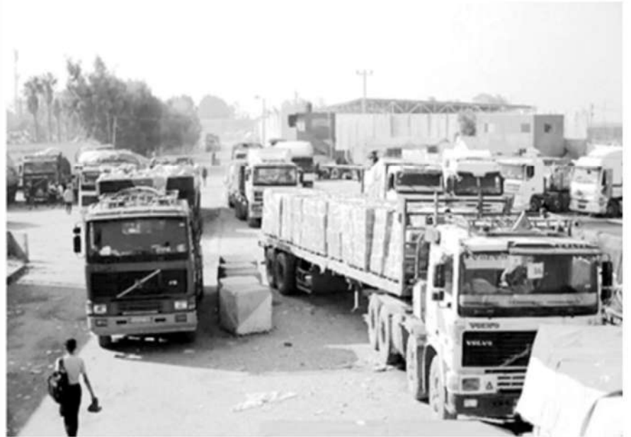
Camiones cargados con suministros de ayuda humanitaria, en el cruce fronterizo de Kerem Shalom, entre Israel y la franja de Gaza, el 18 de diciembre de 2023.

La Jornada, Washington, 18 de diciembre de 2023.- Camiones comerciales que no forman parte de un convoy humanitario entraron en la franja de Gaza por primera vez desde el comienzo de la guerra, informó este lunes Estados Unidos.