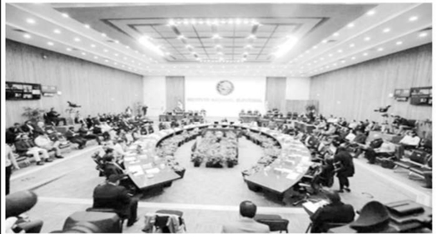
Sesión plenaria del INE el 15 de diciembre de 2023.

La Jornada, 16 de diciembre de 2023.- En otro episodio de acusaciones entre los integrantes del consejo general del Instituto Nacional Electoral (INE), este sábado fue aprobado un «mecanismo extraordinario» que obliga a la consejera presidenta, Guadalupe Taddei, a presentar nuevas propuestas para los principales mandos del organismo que operan desde hace varios meses con encargados de despacho.