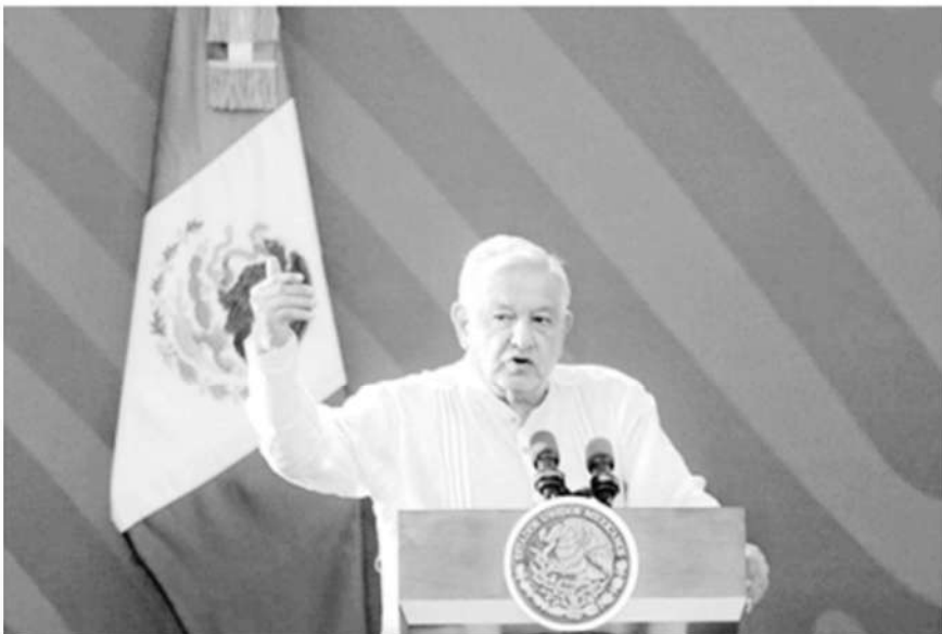
El presidente Andrés Manuel López Obrador recordó que hoy encabezará la inauguración de la presa Santa María.

La Jornada, Ciudad de México, 18 de diciembre de 2023.- Al destacar la inauguración de la presa Santa