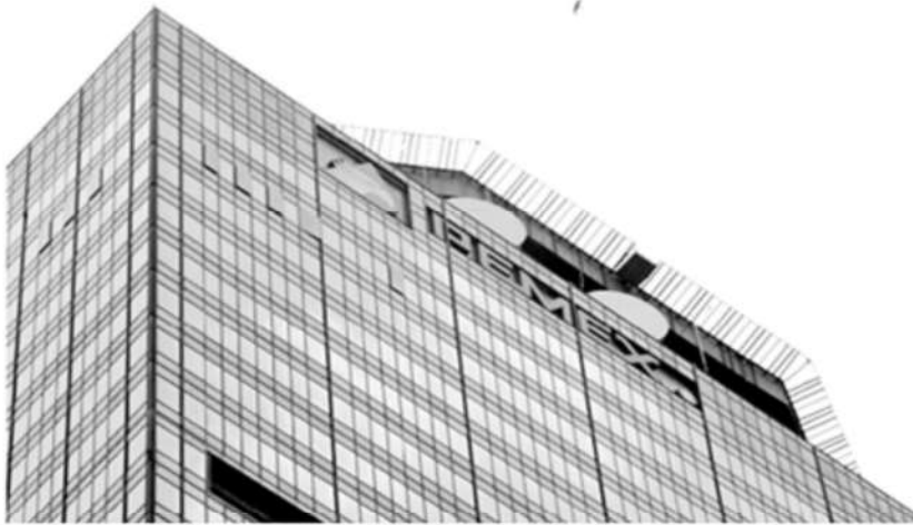
La Torre de Pemex en la Ciudad de México.

La Jornada, Ciudad de México, 18 de diciembre de 2023.- Petróleos Mexicanos (Pemex) informó este lunes que a inicios del mes renovó una serie de líneas de crédito que tiene con más de 30 bancos, por un monto que asciende a ocho mil 300 millones de dólares.