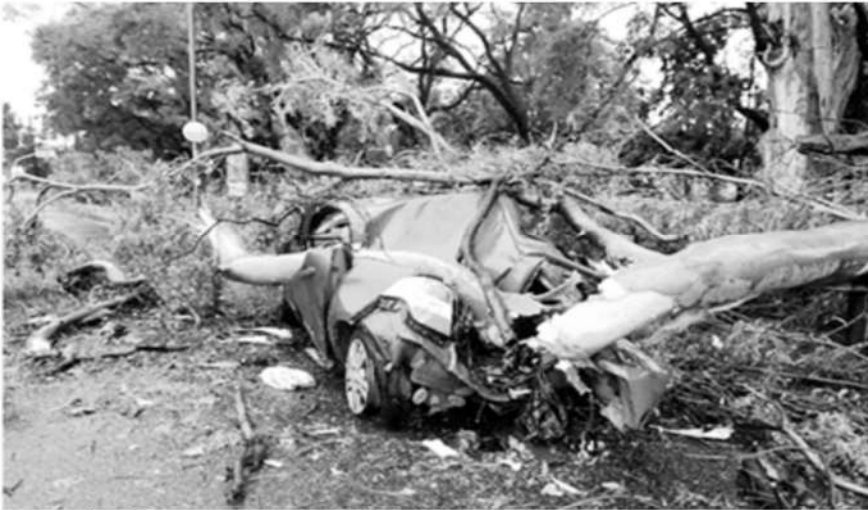
En la ciudad portuaria de Bahía Blanca, al suroeste de Buenos Aires, la poderosa tormenta provocó la muerte de al menos 13 personas, luego de que se desplomara el techo de un club deportivo.

La Jornada, Buenos Aires, 17 de diciembre de 2023.- Muerte, destrucción y daños cuantiosos dejó una tormenta transformada en huracán algo nunca visto en el país con vientos de entre 100 y ciento 50 kilómetros por hora, con saldo de graves secuelas especialmente en Bahía Blanca, en esta capital y la provincia de Buenos Aires, cuando las medidas económicas anunciadas por el gobierno del presidente, Javier Milei, impactaron sobre los sectores más vulnerables, lo que puede transformarse en lo que llaman aquí un genocidio social.