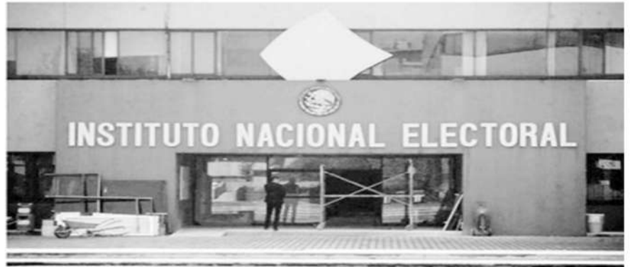
Instalaciones del INE en imagen de archivo.

La Jornada, Ciudad de México, 17 de diciembre de 2023.- El Instituto Nacional Electoral (INE) intensificará, entre enero y junio de 2024, la Estrategia Integral de Promoción del Voto de los mexicanos residentes en el extranjero en redes sociales y plataformas digitales; en radio y televisión en México y en el exterior; contacto directo con la ciudadanía; canales disponibles de la Red Consular, y dirigidas a familiares y amistades de las personas migrantes.