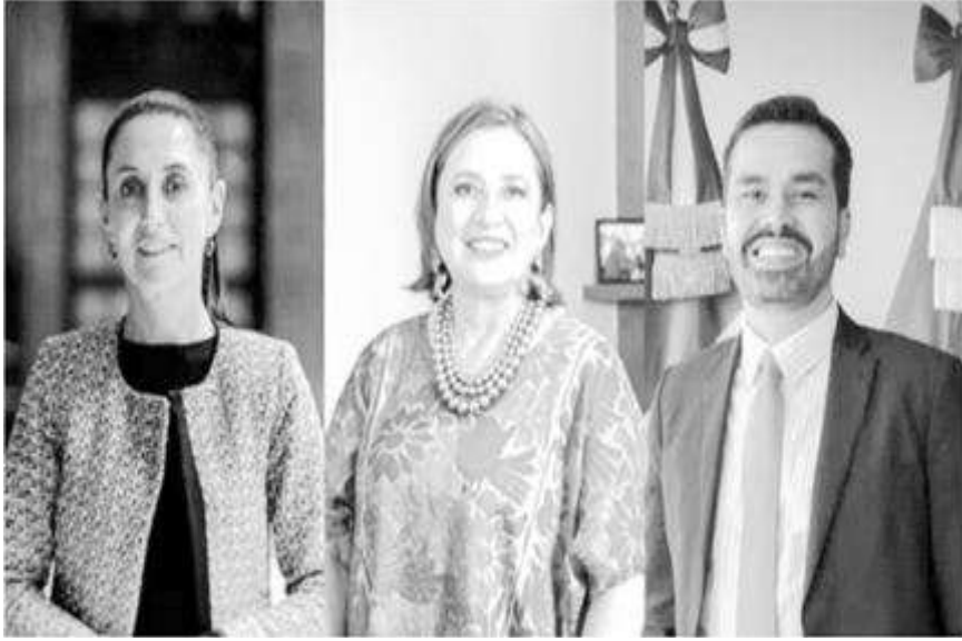
Claudia Sheinbaum, Xóchitl Gálvez y Jorge Álvarez Máynez.

Cuatro experimentados estrategas electorales analizan las fortalezas y debilidades de los aspirantes a la presidencia y por dónde pasan las claves para la victoria