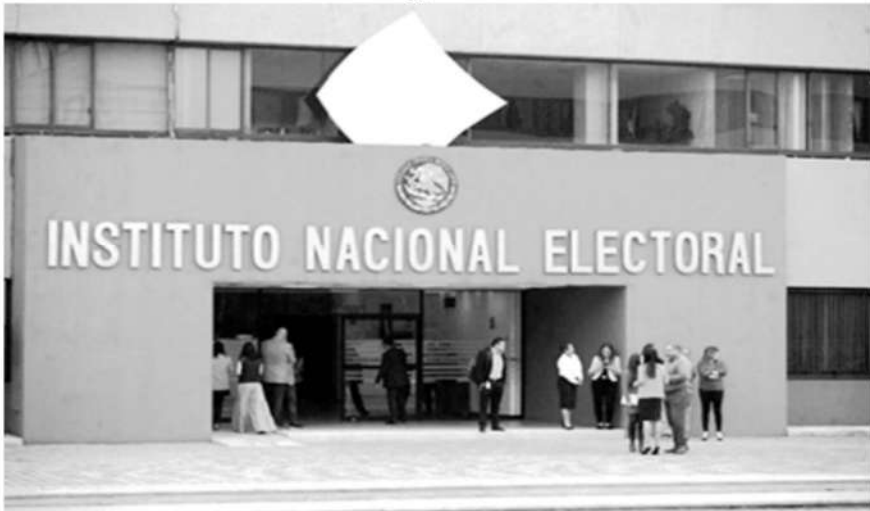
Instalaciones del Instituto Nacional Electoral en la Ciudad de México.

La Jornada, 19 de enero de 2024.- Los candidatos a la Presidencia de la República tendrán la obligación de asistir a los tres debates oficiales organizados por el Instituto Nacional Electoral (INE).