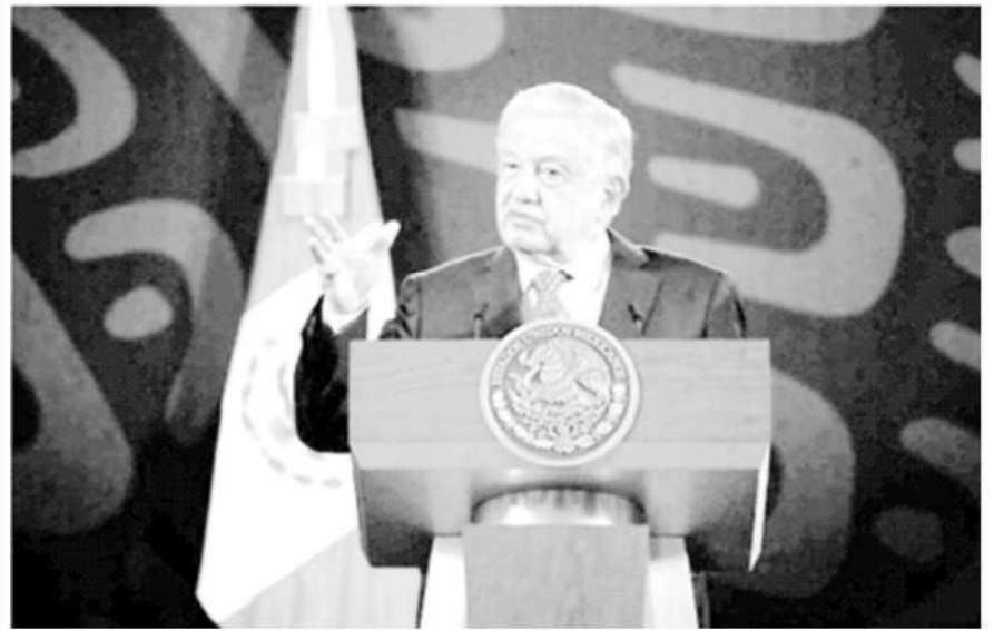
El presidente de México, Andrés Manuel López Obrador, durante su conferencia matutina en Palacio Nacional, en la Ciudad de México, el 17 de enero de 2024.

La Jornada, 18 de enero de 2024, Ciudad de México. Al abrir la mañana de este jueves, el presidente Andrés Manuel López Obrador destacó que de acuerdo con la reciente Encuesta de Percepción de Seguridad del Inegi, «son muy buenos los resultados», pues disminuyó el porcentaje de personas que se sienten inseguras. «Es lo más bajo en diez años».