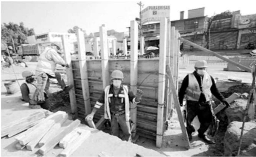
Trabajadores de la construcción.

La Jornada, 18 de enero de 2024.- Durante el sexenio de Andrés Manuel López Obrador, el crecimiento económico promedio anual será de 0.3 por ciento, que si bien es positivo, sería el más bajo desde la administración de Miguel de la Madrid entre 1982 y 1988, planteó un estudio realizado por Banca Mifel.