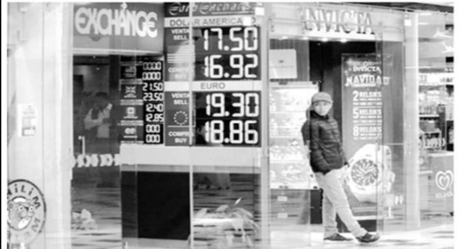
Este jueves el tipo de cambio en México se mantuvo en 17.19 pesos por dólar.

La Jornada, 18 de enero de 2024, Ciudad de México. El peso mexicano rompió con una racha de tres sesiones a la baja, al ganar este jueves 0.23 por ciento este jueves frente a la divisa estadounidense, para cerrar en 17.1901 unidades por dólar spot. La moneda nacional operó de manera errática, pues, aunque los inversionistas tuvieron un mejor ánimo para comprar activos de más riesgo, en medio del deterioro de las apuestas sobre las futuras decisiones de la Reserva Federal (Fed) sobre esperar más tiempo para descender las tasas de interés, pero cerró con una ligera ganancia. El dólar se desinfló en la recta final de la sesión, pero terminó en terreno positivo frente a una canasta de seis monedas internacionales, al apreciarse 0.03 por ciento, a 102.237 unidades. Por su parte, la Bolsa Mexicana de Valores (BMV) cerró la sesión