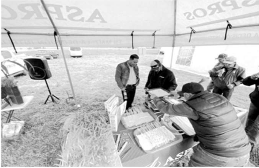
Presentación de las semillas híbridas del maíz.

La Jornada, 18 de enero de 2024, Calimaya, Méx. La empresa Aspros, dedicada a la investigación y desarrollo de maíz de alto potencial de rendimiento, presentó este jueves la semilla híbrida denominada «Comanche» para la producción de este grano en los valles altos, la cual permite duplicar el rendimiento promedio mensual que te da una semilla normal y triplicarse en suelos por arriba de los dos mil metros de altura sobre el nivel del mar.